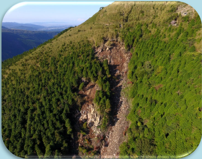
ガリー対策工 着手前 □ 11月2日にドローンで撮影しました □