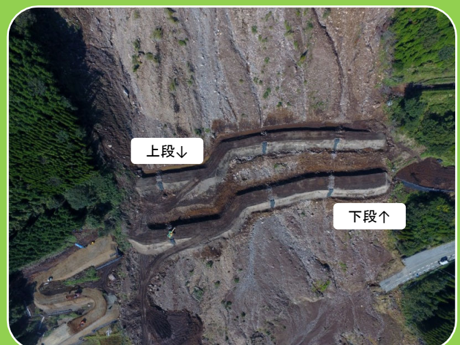
土留盛土工（ドローンによる撮影）