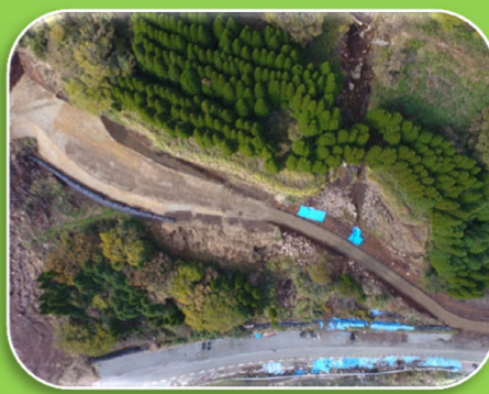
2号工事用道路ドローン撮影状況