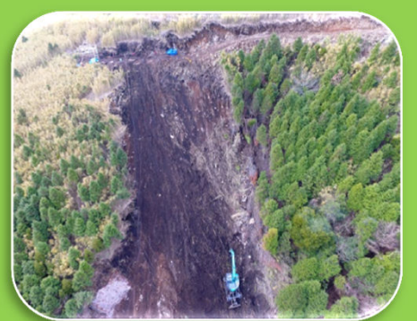
ガリー対策工施工状況 ■ 急斜面にて除石作業を行っています ■