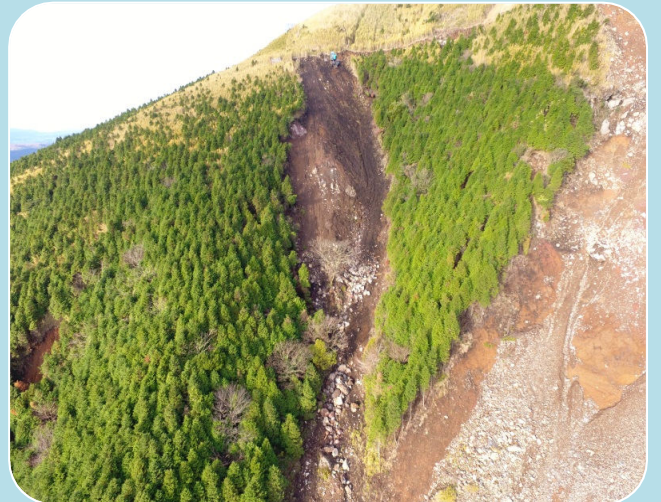
ガリー対策工 巨石及び岩塊除去作業完了後 □ 12月24日にドローンで撮影しました □