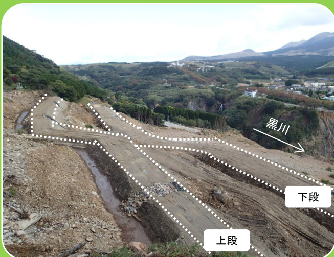
土留盛土工（熊本側より撮影）