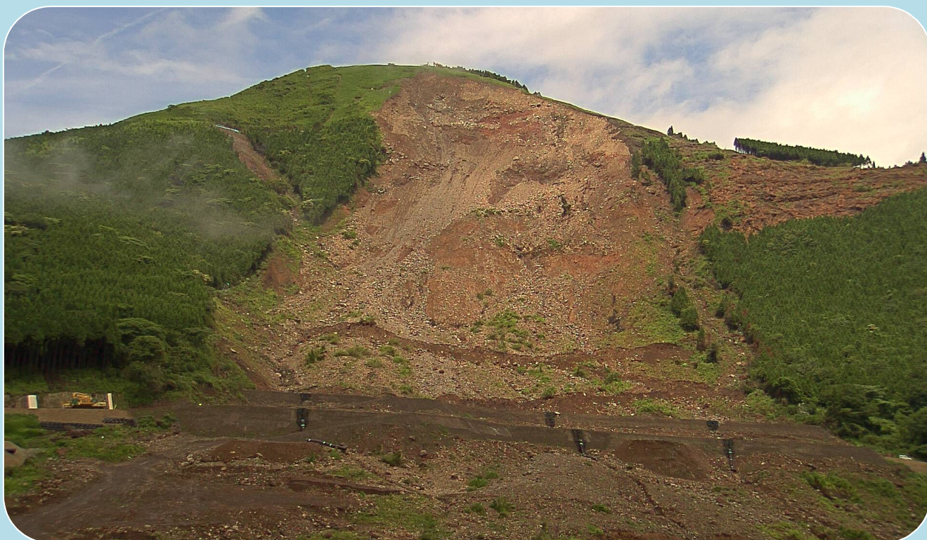
阿蘇大橋地区斜面崩壊対策の進捗状況 (平成29年6月30日撮影)

現在、崩壊地内堆積土砂撤去工、頭部工事用道路工、斜面排土工準備工等を行っています。梅雨に入り、アジサイが各所できれいな花を咲かせ、見ごろの時期となりました。今月もどうぞ宜しくお願い致します。