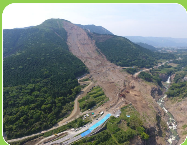
全景写真（ドローンによる撮影）