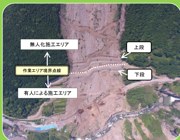
土留盛土工（ドローンによる撮影）